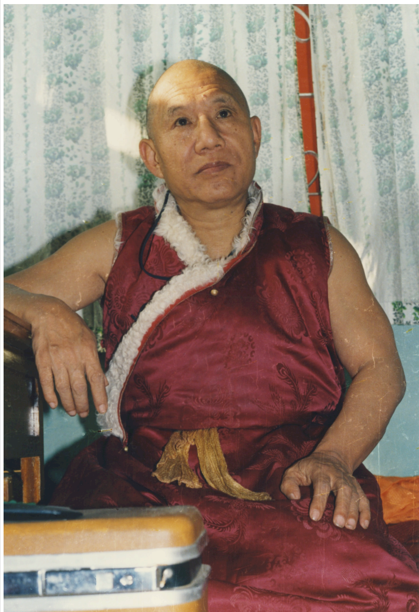
Kyabje Dodrupchen Rinpoche 1927 - 2022